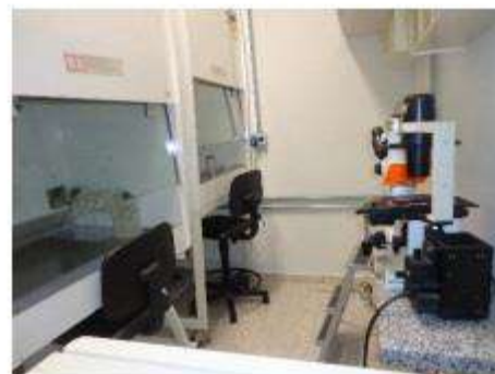
Sala de cultura de células com microscópio invertido.