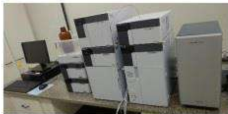
Cromatógrafo Líquido de Alta Eficiência (CLAE)