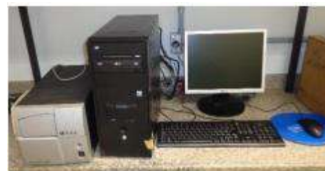
Leitor de placas (ELISA).