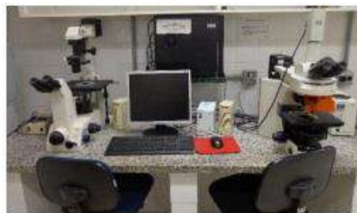
Microscopia de captura.