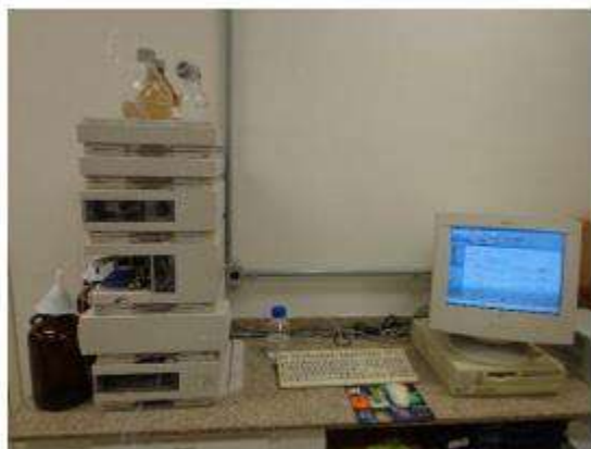
Cromatógrafo Líquido de Alta Eficiência (CLAE)

Serviços: identificação de praguicidas (carbamatos), estricnina, arsênio, cianeto, paraquat, monóxido de carbono e alguns medicamentos.