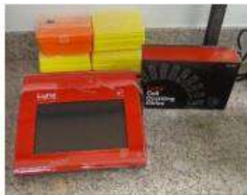
Contador de células automático.

Laboratório didático utilizado em aulas práticas de disciplinas de Farmacologia e Toxicologia. Apoia as atividades científicas dos demais laboratórios, sendo caracterizado por atividade multiusuário.